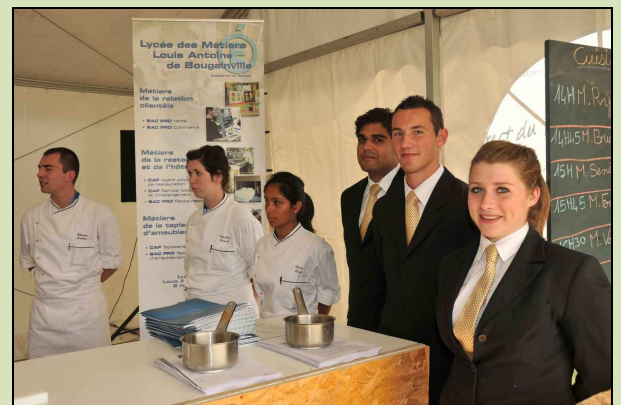
Les élèves du Lycée sainte anne, l'avenir de la restauration sensibilisé aux produits des races locales