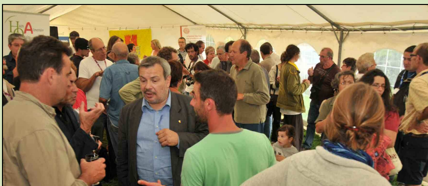
Apéritif après le forum Slow Food, lieu de discussions entre éleveurs, consommateurs et membres du mouvement